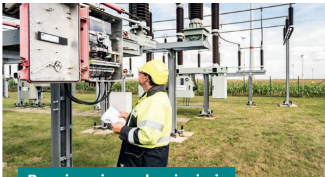
Rozwiązania w zakresie sieci

Projektujemy i budujemy sieci energetyczne wraz z podstacjami transformatorowymi oraz podłączamy je do publicznej sieci energetycznej. Załatwiamy wszystkie formalności z operatorem sieci z uwzględnieniem wszystkich niezbędnych przepisów i norm.